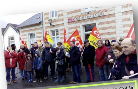
70 personnes ont manifesté à l'appel de la Cgt le 10 décembre 2017 pour l'inauguration de la rénovation de la ligne Quimper-Landerneau

Un millier de personnes s'est mobilisé massivement le 3 décembre 2017 pour contester le projet de la région. Une nouvelle manifestation aura lieu à Rennes le 14 décembre prochain devant le Conseil régional.