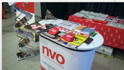
Le bureau du Comité régional a pris la décision de commander un stand NVO qui peut être utilisé dans les Assemblées Générales, réunions... de la Cgt sur la Bretagne. C'est un moyen d'encourager la lecture et l'abonnement du journal de la Cgt. Chaque Union Départementale à son référent NVO pour organiser le prêt de ce matériel.