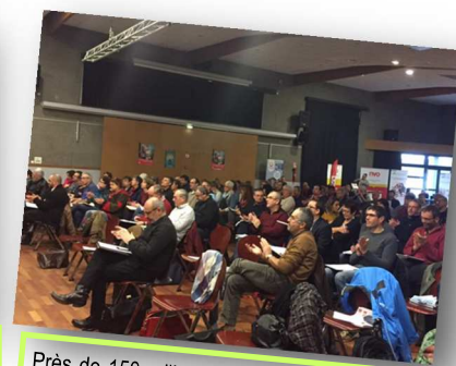
Près de 150 militants de la Cgt ont assisté au forum Travail-Santé-Protection Sociale le 5 décembre 2017 au Relecq Kerhuon dans le Finistère.