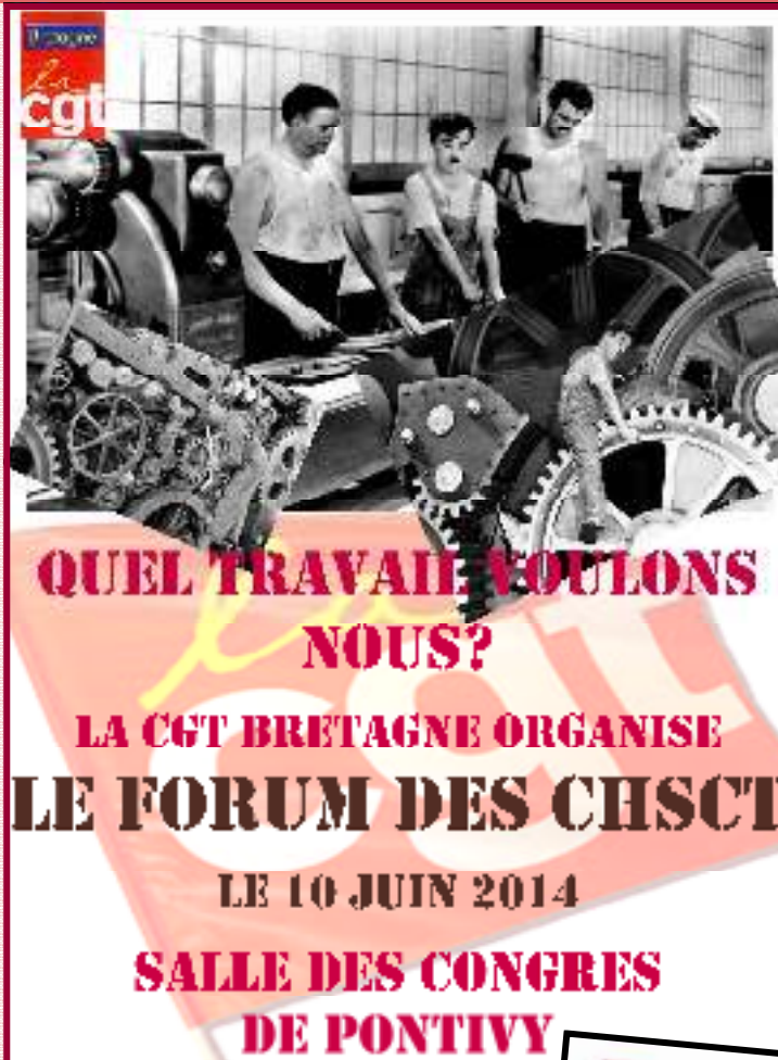
Fiche de renseignements des syndicats

1er Forum des CHSCT à Pontivy Mardi 10 juin 2014