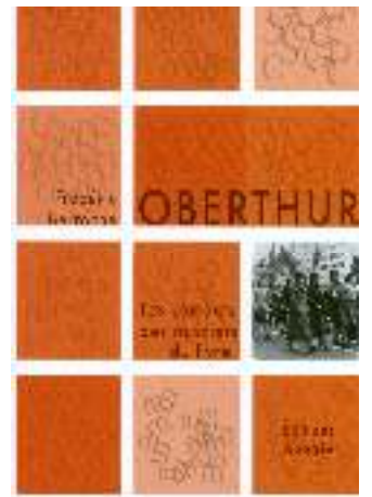
Le livre de Fred Berroche sur Oberthur et les combats des ouvriers du livre