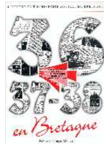
36, 37, 38 en Bretagne