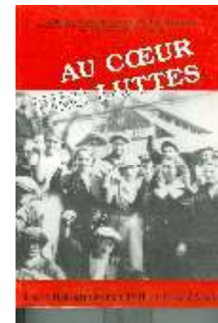
Le livre de l'U.D. C.G.T. des Côtes d'Armor « Au cœur des luttes »