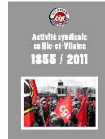
L'ouvrage de l'U.D. C.G.T. d'Ille et Vilaine sur l'histoire des bourses du travail de Rennes