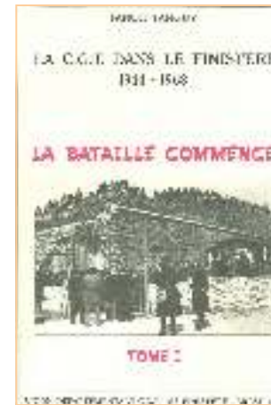
Les trois tomes écrits par Fanch Tanguy sur la C.G.T. dans le Finistère

Depuis la création de l'Institut CGT d'Histoire Sociale de Bretagne de nombreuses publications ont été réalisées sur la CGT et les luttes en Bretagne.