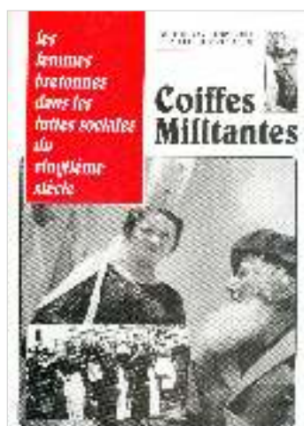
Les Coiffes Militantes