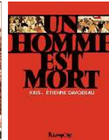
La bande dessinée sur l'histoire du militant CGT Finistérien Édouard Mazé « Un homme est mort »