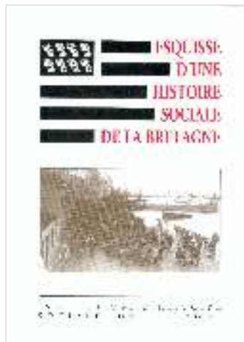
Esquisse d'une histoire sociale de la Bretagne