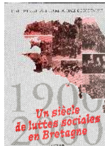
Un siècle de luttes sociales en Bretagne