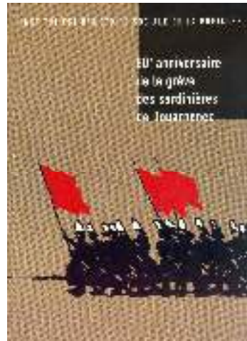
80ème anniversaire de la grève des sardinières