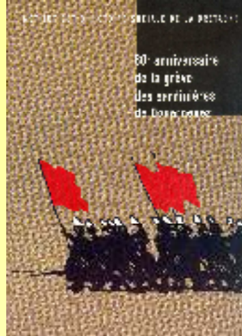
80ème anniversaire de la grève des sardinières de Douarnenez 15€