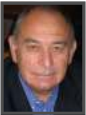
Par Jacques COLIN Président de l'Institut