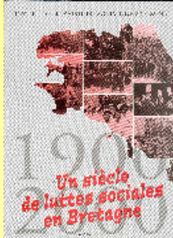
Un siècle de luttes sociales en Bretagne 10€