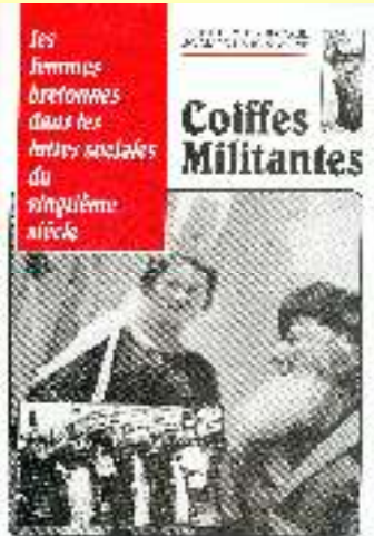
Les coiffes militantes 15€