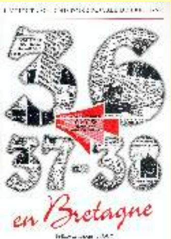
36-37-38 en Bretagne 10€