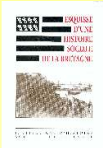
Esquisse d'une histoire sociale de Bretagne 10€

Celles-ci sont disponibles au niveau des Unions Départementales et des responsables des collectifs départementaux.