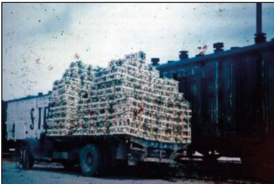
Dans les années 1950 et 1960, une large part de l'expédition des légumes de la zone du Haut-Léon se fait par voie ferrée, au départ de Roscoff ou Saint-Pol-de-Léon.