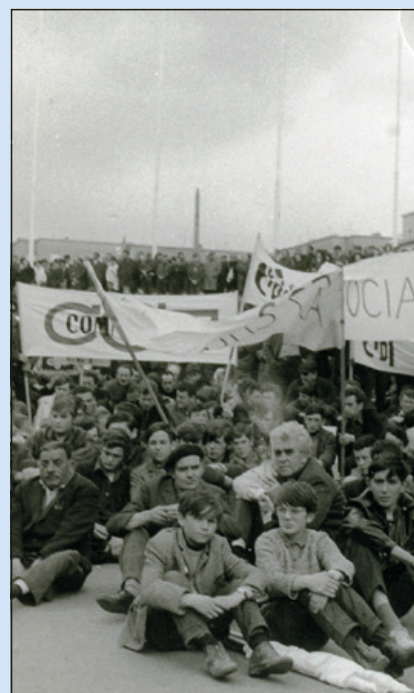
Brest. Manifestation en mai 1968.

Dans quelques semaines la CGT et l'IHS célèbreront les 50 ans du grand mouvement social de mai 1968. Au programme de l'IHS, une brochure régionale, un numéro spécial de « Mémoire Vivante » et une exposition finistérienne.