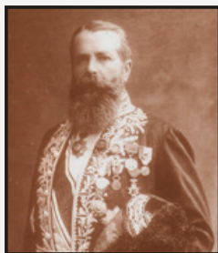
Le préfet Collignon en grand uniforme.