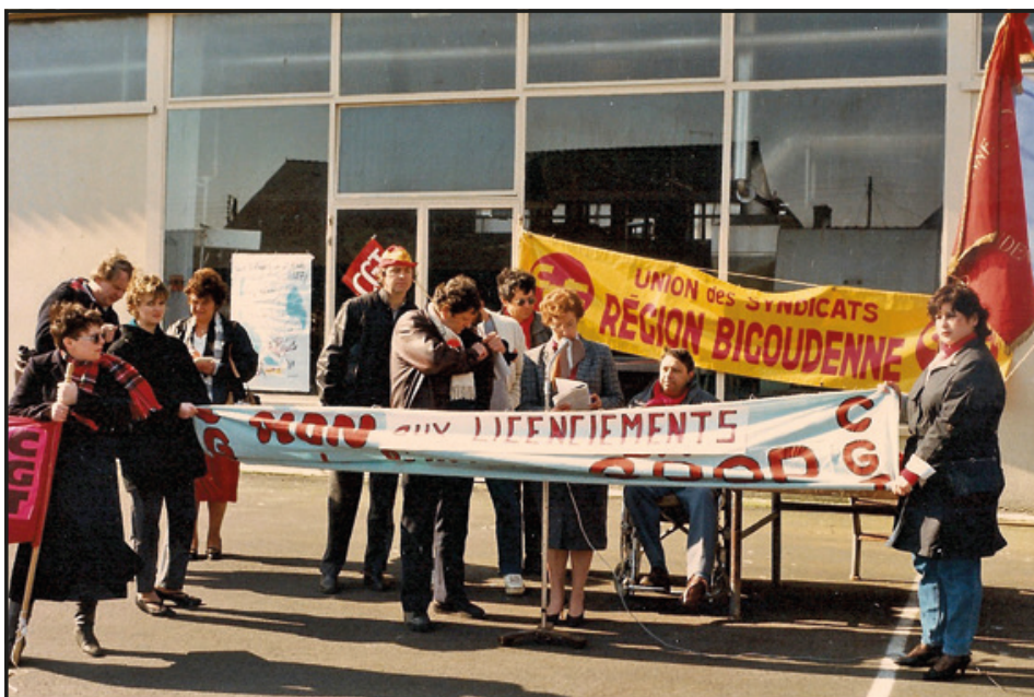
Au Guilvinec, en mars 1987, la lutte se poursuit pour la sauvegarde de Saint-Gué Coop.

M. Debatisse (ministre de l'Agro-alimentaire). Surplus de stock, manque de compétitivité et d'investissements fragilisent ce groupe qui vient de fusionner avec Vernet pour devenir Loiremer. Les marins, par leur coopérative Saint Gué Coop, sont sollicités pour financer une entreprise qui ne leur profite guère, puisque la conserverie travaille surtout du poisson « d'intervention ».