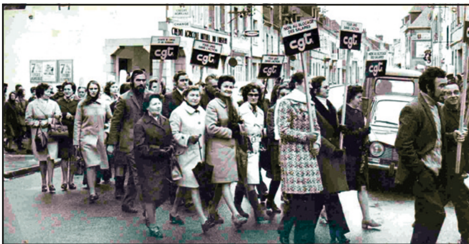
1977. Manifestation de grévistes, dans les rues de Pont-l'Abbé, à l'appel de la CGT.

Février 1981.- A Saint-Gué Pêcheurs de France, usine occupée par le personnel (pendant trois mois, avec le soutien de la CGT), 92 employés sont au chômage technique. Les ouvrières vont en car à Paris pour rencontrer