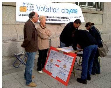
RECUEIL DE SIGNATURES A LA ST MICHEL DE BREST

Vos brèves sont à faire parvenir à l'UD cgt 2, pl E Mazé 29200 Brest 0298443755 0298444965 ud29@cgt.fr Tous les « VITE LU VITE SU » sont disponibles sur le site du Comité Régional : www.cgt- bretagne.fr