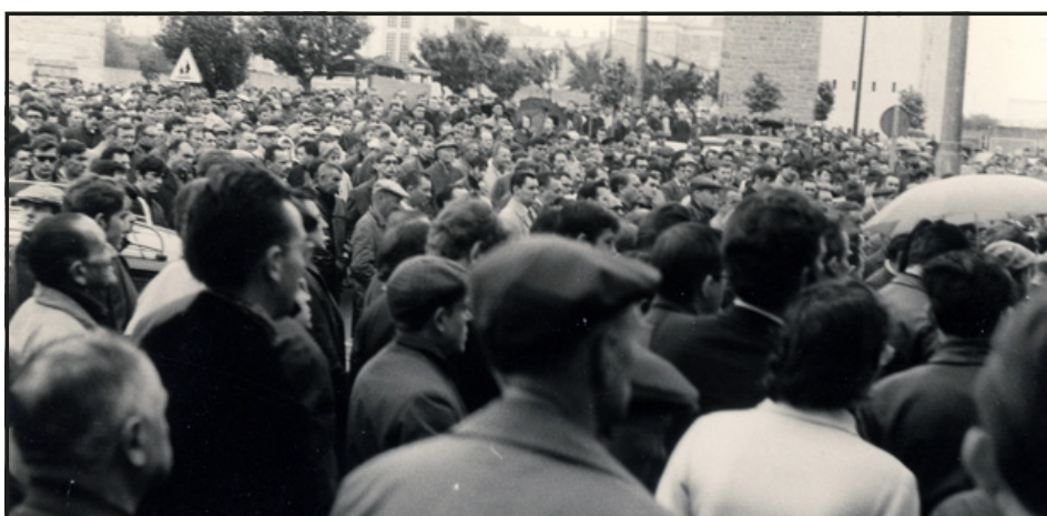
A Brest, après le 13 mai, les manifestations se succèdent chaque jour (ci-dessus, devant la Maison du Peuple).

Les électriciens-bord (en haut) ont été de tous les meetings.