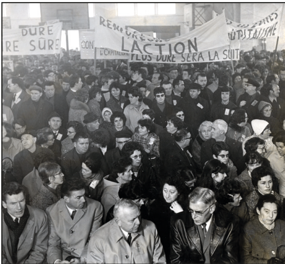
En mai 68, et dans les mois qui ont précédé, actions syndicales et manifestations ont touché toutes les catégories et toutes les générations.

Satisfaire les revendications : c'est possible.- Comme toujours, le patronat a crié haut et fort que satisfaire les revendications des