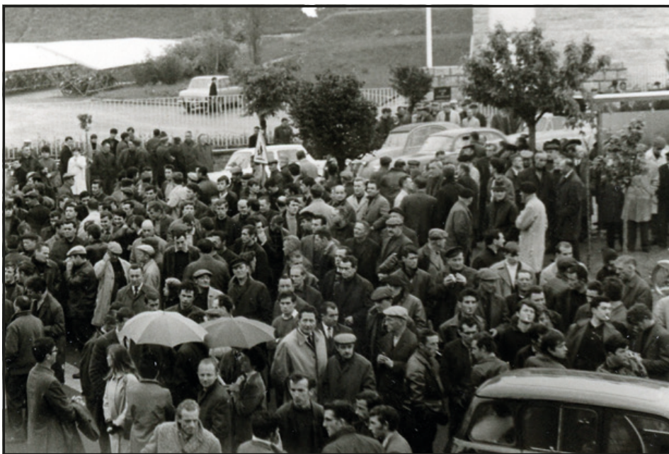
L'une des nombreuses manifestations brestoises.

Ce jour-là, à Port-Launay, une rencontre CGT-FDSEA aboutit à un accord : tout sera fait par les organisations CGT pour assurer aux agriculteurs le ravitaillement des aliments nécessaires pour les animaux, ainsi que le ramassage laitier. L'UD CGT propose aux agriculteurs des manifestations communes le 24 mai. Ce jour-là, en effet, de Gaulle a décidé de s'adresser au pays. Afin de faire pression sur le gouvernement pour