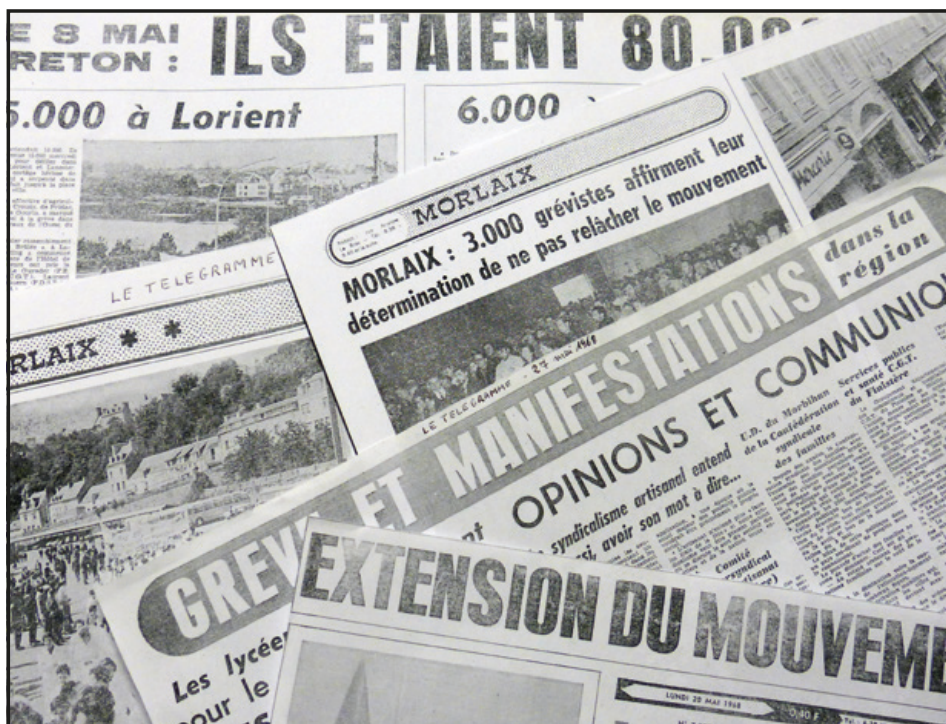
En mai 68, la plupart des quotidiens ont continué à paraître. Une parution, avec l'accord de la Fédération du Livre, donnant priorité à l'information dans le contexte des grèves quasi généralisées.

« Contrairement aux hebdomadaires nationaux, les quotidiens ont été imprimés, la FFTL ayant décidé « de laisser paraître la presse dans la mesure où celle-ci accomplira avec objectivité le rôle d'informateur qui est sa vocation ». La radio et la télévision nationales (ORTF), aux mains du pouvoir gaulliste, manquaient d'impartialité pour relater les événements. La presse écrite, contrôlée par les salariés grâce à un rapport de force favorable, permit une information plus objective de la population sur la situation nationale, régionale, locale. C'était aussi le