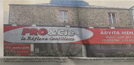
L'ancien magasin Pro et Cie, situé au premier étage de la Maison du peuple, a été détruit par un incendie il y a cinq ans.

Toujours sur les bourses du travail et maisons du peuple en Bretagne, un article a été repris dans un récent n° de Rapid Info, publication du Comité régional CGT Bretagne.