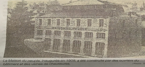
La Maison du peuple, inaugurée en 1908, a été construite par des ouvriers du bâtiment et des usines de chaussures.