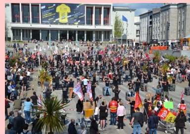
A Brest, ce ne sont pas loin de 2000 manifestants qui étaient présents.

Et à Morlaix, plus d'une centaine de participants !