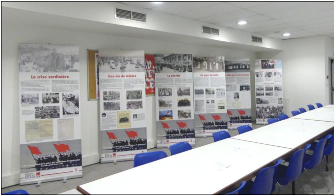
Exposition « Lutte des sardinières de Douarnenez »