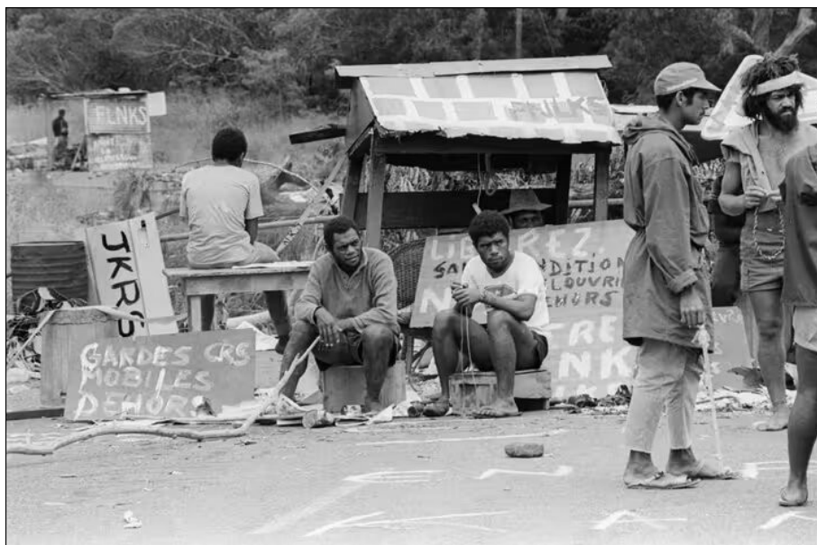
Novembre 1984 - Manifestation kanak.

L'article 10 est sans équivoque : « Dans les territoires relevant du ministère de la France d'outre-mer, les élections à l'Assemblée nationale, aux assemblées territoriales, aux assemblées provinciales de Madagascar, aux conseils de circonscription et aux assemblées municipales ont lieu au suffrage universel des citoyens des deux sexes, quel que soit leur statut, âgés de vingt et un ans accomplis, régulièrement inscrits sur les listes électorales et n'étant dans aucun cas d'incapacité prévue par la loi. Les peines entraînant la non-inscription sur les listes électorales sont celles fixées par les lois en vigueur dans la métropole » .