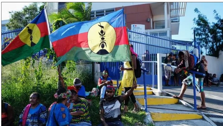
Mai 2024, drapeau kanak devant le tribunal de Nouméa

En janvier 2024, un projet de loi constitutionnelle modifie le code électoral de la Nouvelle-Calédonie, permettant l'inscription d'environ 25 000 électeurs supplémentaires, majoritairement d'origine européenne.