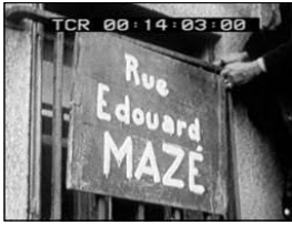
La plaque apposée rue Kérabécam, le 18 avril

parole, la foule se rend rue Kérabécam, rebaptisée rue Édouard Mazé