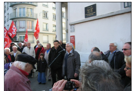
Commémoration en 2010, rue Kerabécam