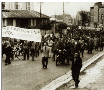
Départ de la manifestation de 17 avril

Policiers, gendarmes, gardes mobiles et CRS sont en masse dans la ville. Après les prises de parole à la maison des syndicats, la manifestation démarre à 16 heures pour se rendre à la sous-préfecture.