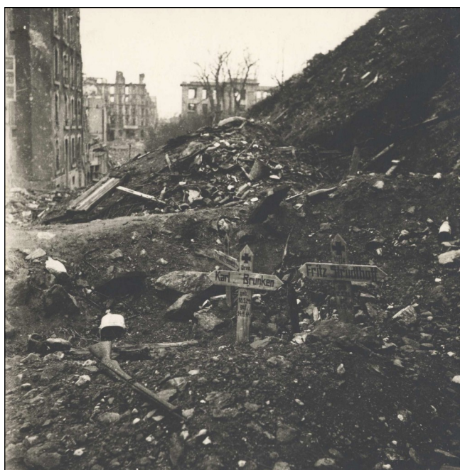
Les fortifications, rue Colbert - au fond, l'hôtel Moderne et la Poste

Dans Brest en ruine, mal logés dans des baraques, mal nourris en raison des salaires de misère, mal remis des deuils, les ouvriers du bâtiment reconstruisent la ville. La guerre du Viet-Nam draine des milliards, au détriment de la population. Dockers, marins et cheminots s'opposent au transport du matériel de guerre. Les travailleurs, qui n'ont pas ménagé leurs peines, exigent une juste rémunération de leur travail. Le gouvernement et le grand patronat, y compris celui qui a collaboré, répondent par le mépris et la répression. La tension est à son comble.