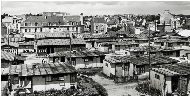
Le quartier du polygone, après guerre

Le lendemain, le sous-préfet, après avoir reçu les patrons et tenté de faire plier les délégués, les informe qu'il convoque une commission de conciliation.