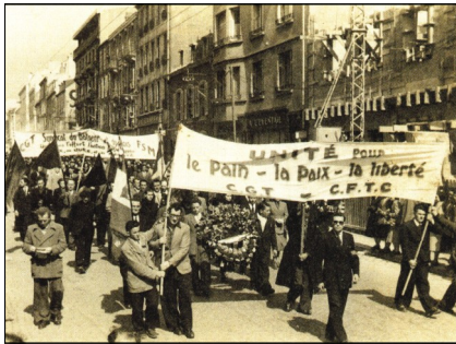
Le cortège lors des obsèques

Dans l'après-midi, Pierre Mazé et les blessés portent plainte, elles resteront sans suite.