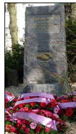
La stèle, place Edouard Mazé