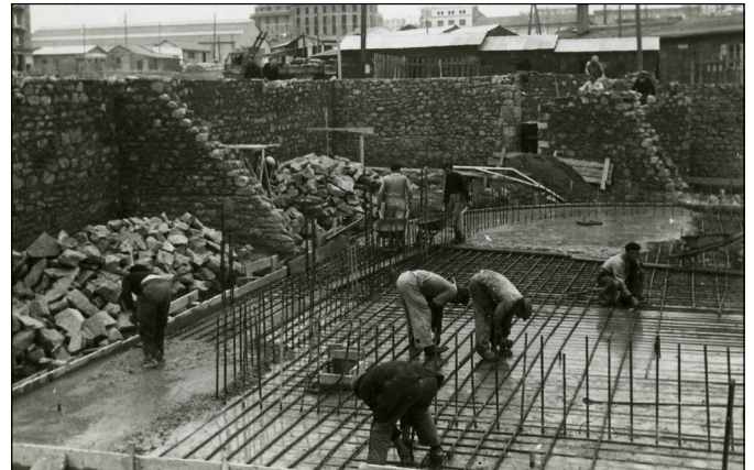
Reconstruction de la Caisse d'épargne

La municipalité brestoise vote le 27 mars des aides aux grévistes : cantines scolaires gratuites pour les enfants, y compris pendant les vacances ; cantines de la ville gratuites pour les grévistes célibataires ; bons d'achat de 100 francs par jour pour les « pères de famille ». Le 11 avril, elle accorde des bons d'achat de lait pour les enfants de sept mois à six ans.