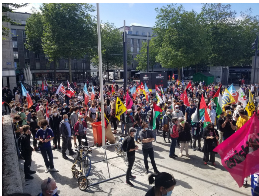
12 juin 2021 - Manifestation contre l'extrême droite à Brest

« Par deux points fascistes passe une extrême droite et une seule » Jean Roger Gouyé, dit Jean Yanne