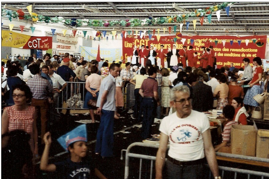
1978 Kermesse CGT à Lesconil

Ils aiment à raconter que le patron du bateau, en même temps qu’il encaissait le “rôle d’embarquement”, en profitait pour exiger du matelot la remise de la carte CGT. Plutôt paradoxal à la CGT !