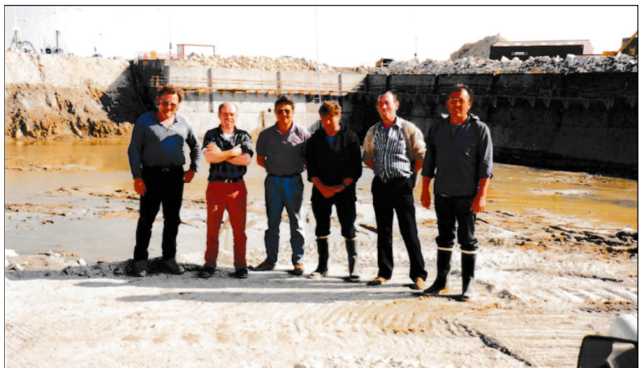
Le bureau du syndicat des marins avec les responsables du chantier. Demain, l'eau recouvrira leurs pas !!! (28 mai 1991)

Bon nombre de démarches ont été entreprises tant au Conseil Portuaire de Lesconil, auprès de la Municipalité, du Conseiller Général de la circonscription, ... et au préfet du Finistère.”